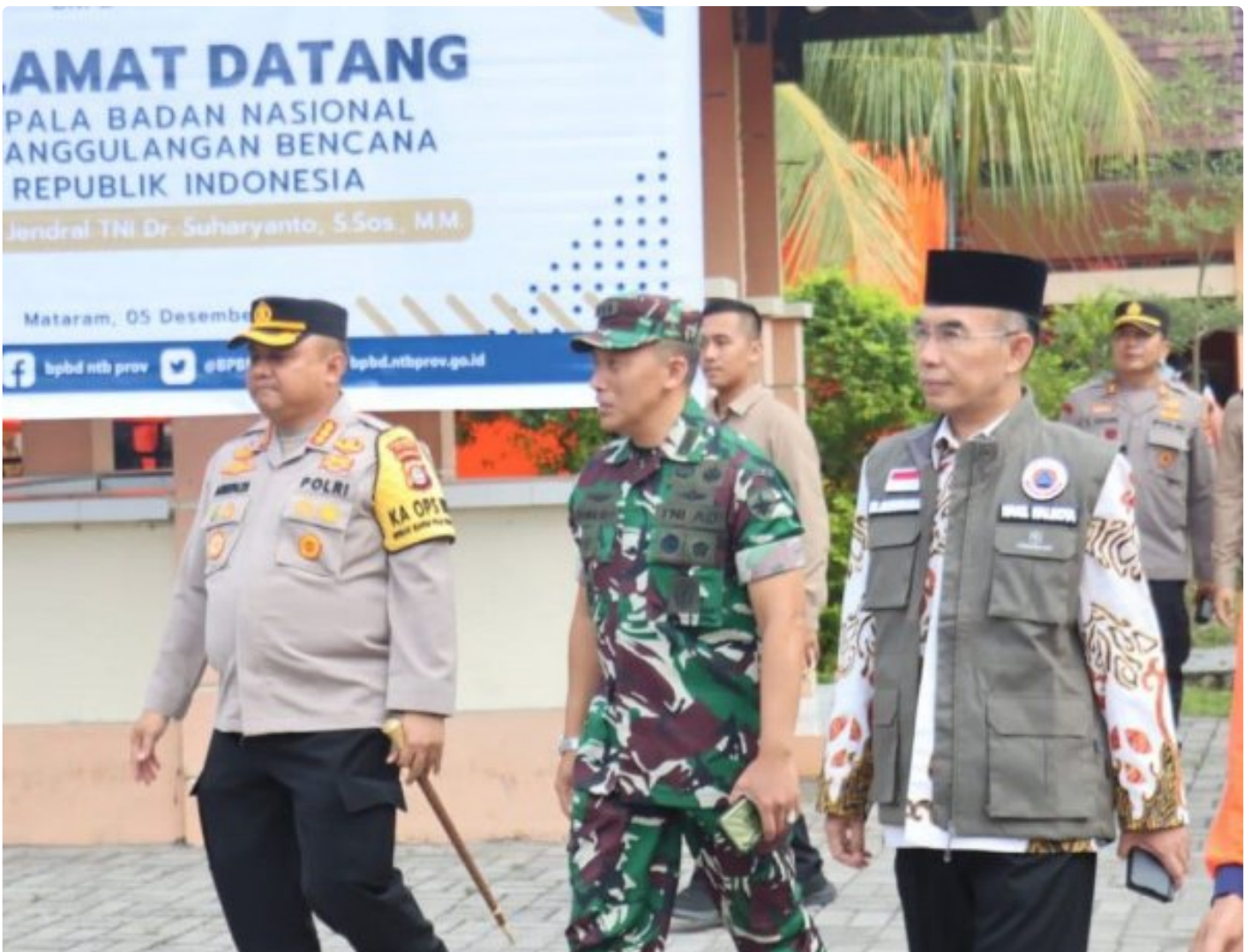
Kapolresta Mataram (Kiri) saat menghadiri acara Peletakan batu Pertama pembangunan gedung Pusdalops BPBD